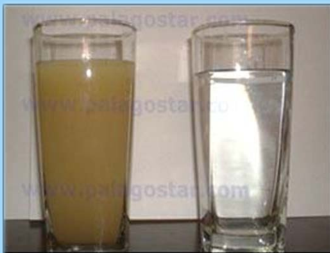
مقایسه آب قبل و بعد از تصفیه