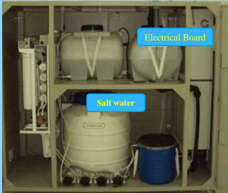
سیستم گندزدایی آب